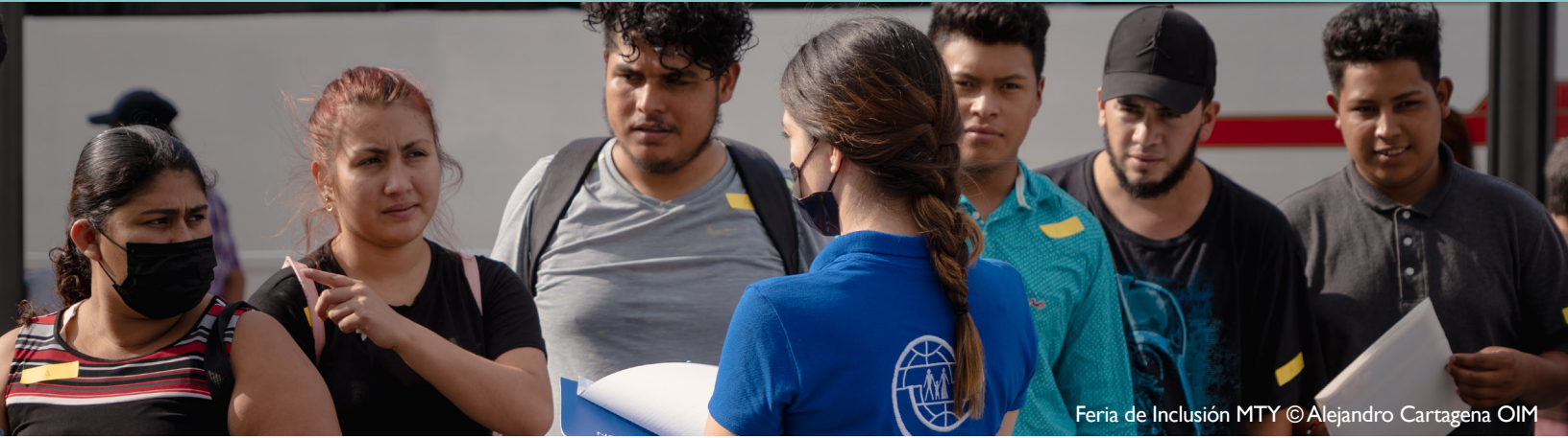
Feria de Inclusión MTY