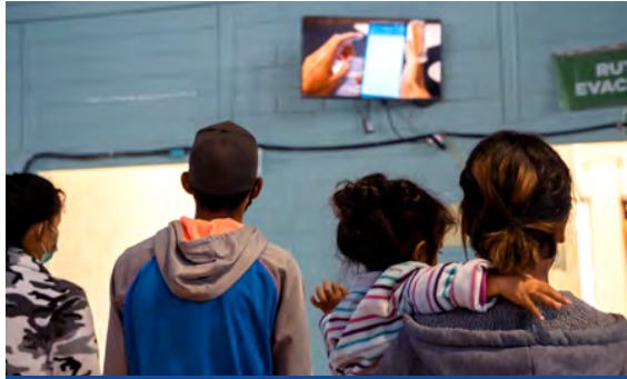
Personas migrantes mirando el contenido en una pantalla informativa en Ciudad Juárez.

La Organización Internacional para las Migraciones (OIM) impulsa desde el 2021 la "Iniciativa de Pantallas Informativas" a través de su Programa de Respuesta Humanitaria (HRP). El proyecto tiene como objetivo fomentar una toma de decisión informada por la población migrante facilitando el acceso a información por medio de pantallas informativa y conectividad a internet. La OIM estableció una alianza con Télécoms Sans Frontières (TSF), una organización no gubernamental humanitaria especializada en el uso de las telecomunicaciones en situaciones de emergencia.